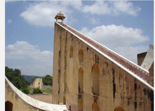
Sonnenuhr in Jaipur